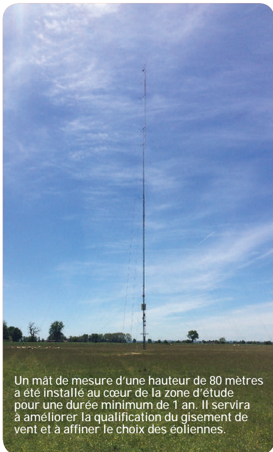
Un mât de mesure d'une hauteur de 80 mètres a été installé au cœur de la zone d'étude pour une durée minimum de 1 an. Il servira à améliorer la qualification du gisement de vent et à affiner le choix des éoliennes.

Des mesures acoustiques de réception seront réalisées à la mise en service du parc pour vérifier cette conformité.